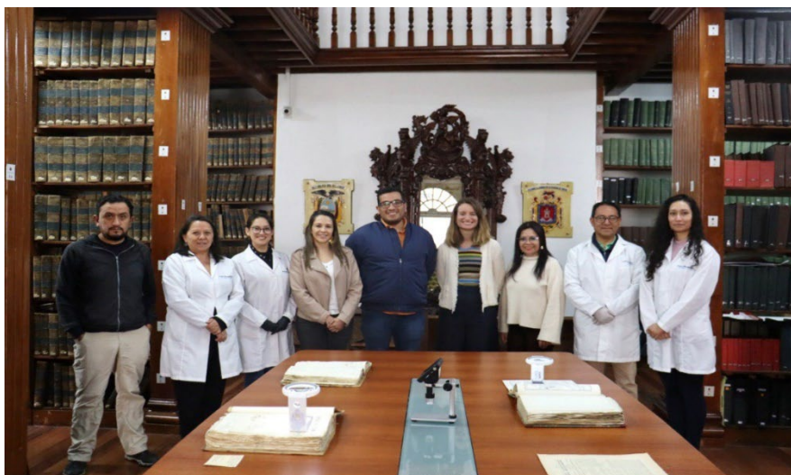
Equipo de trabajo del AMHQ, junto a miembros de la Embajada de España en Ecuador y el Instituto Nacional de Patrimonio Cultural.

Además, el último viernes de cada mes, el archivo abre sus puertas desde las 18:00 para brindar una experiencia diferente a sus visitantes, a través de las Visitas Guiadas AMH una actividad que desde enero de este año ha acaparado la atención de quienes desean vivir la historia y conocer más de la ciudad a partir de los relatos que resguardan sus documentos patrimoniales.