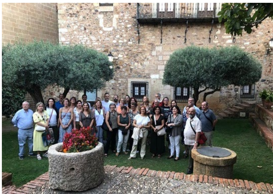
Integrantes de la Mesa de Archivos de la administración Local en una de las visitas.

Paralelamente a la Mesa de trabajo se ha celebrado una Mesa social en la que miembros de la Mesa de Trabajo que ya no tienen responsabilidad de cargos, así como acompañantes, han podido disfrutar de diferentes actividades en la ciudad de Cáceres, como visitas a los museos: Casa Pedrilla, Guayasamín, Helga de Alvear, visita al Archivo Histórico Provincial de Cáceres y compartir almuerzo y cena, con los integrantes “activos” de la Mesa.