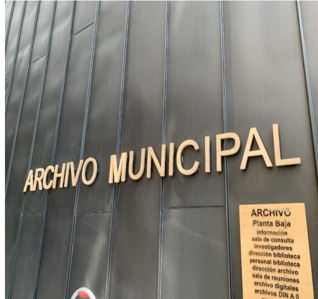
Dos aspectos de la fachada externa del moderno edificio.

El volumen total de los fondos documentales custodiados es de unos 4.000 metros lineales. El número de unidades de conservación es de más de 35.000 cajas de archivo. Dispone de un Portal de Difusión en Internet para acceder a sus fondos, permitiendo la participación e interacción de los usuarios.