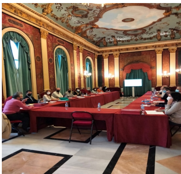
Aspecto de una de las Sesiones de la XXXVII Mesa

Entre las conclusiones cabe destacar que, el archivero debe estar considerado e incluido desde el mismo momento de la implantación de la gestión electrónica, formando parte del equipo de gestión. También se ha planteado la necesidad de incorporar a la Mesa de Archivos a nuevos participantes, que den continuidad a la Mesa en el futuro inmediato. La próxima convocatoria será en 2022, en la ciudad de Logroño, con el tema: “El Archivo, entre la transparencia y protección de datos” .