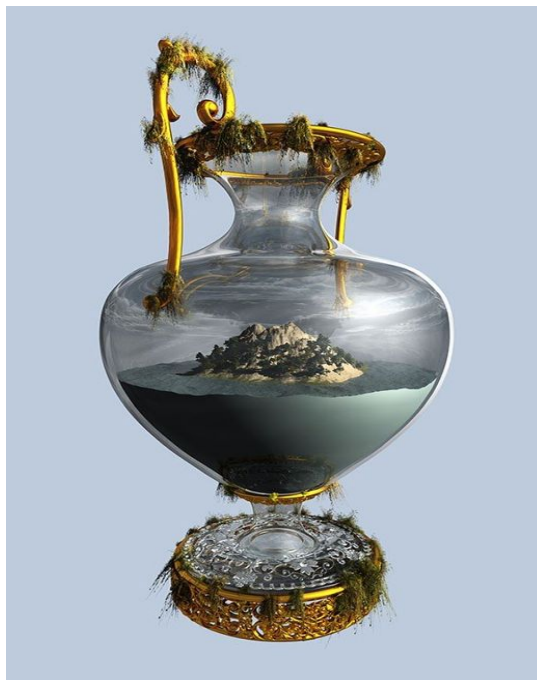
Una interesante pieza de la Exposición

Esta exposición es la cuarta edición del programa “Kora”, comisariado por Rocío de la Villa, que cada año trae a las salas del museo una exposición concebida desde la perspectiva de género. La muestra reúne un total de quince obras, incluyendo pinturas al óleo, vídeos y piezas de cristal tallado con láser, algunas creadas especialmente para la muestra. Diez de ellas se presentan en la sala mirador, con acceso directo desde el hall del museo, y cinco en diálogo con algunas pinturas del Renacimiento en las salas de la colección permanente.