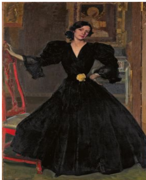
Retrato de Clotilde Sorolla

La rosa ‘Clotilde de Sorolla’. El museo también reimagina, reinterpreta, inspira. El lunes 17 de mayo, se plantó en los jardines del Museo Sorolla, la rosa ‘Clotilde de Sorolla’, creada por la prestigiosa hibridadora Matilde Ferrer, e inspirada en el retrato que Sorolla realiza a su esposa y fundadora del Museo, Clotilde García del Castillo en 1910. Clotilde con traje negro que se encuentra en las colecciones de The Metropolitan Museum, Nueva York. La nueva especie de rosa de color té, se plantó en homenaje a Clotilde y está siendo disfrutada por los visitantes desde el martes 18 de mayo, día Internacional de los Museos.