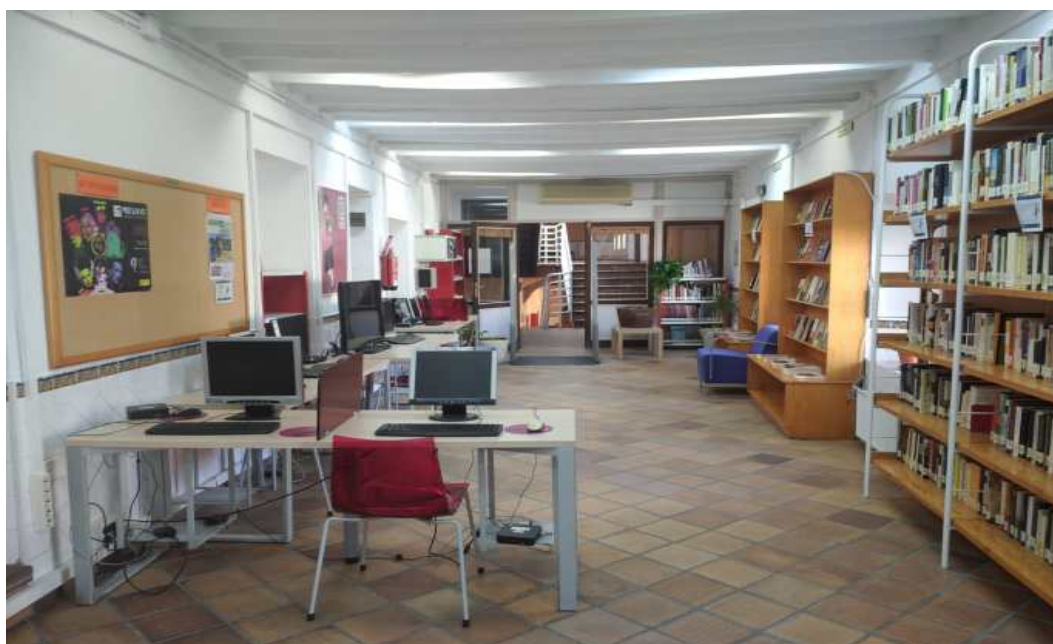
Biblioteca principal de Hellín, (fotografía de "El Faro de Hellín")

El Ayuntamiento de Hellín, a través de su red de Bibliotecas Municipales, ha sido galardonado con el premio a las mejores prácticas en los servicios públicos prestados a la ciudadanía, dentro de la Excelencia y Calidad en los Servicios Públicos que otorga la Junta de Castilla la Mancha anualmente. La candidatura se presentó en 2020 y fue seleccionada por la cantidad y calidad de los proyectos realizados tanto en Hellín como en sus pedanías.