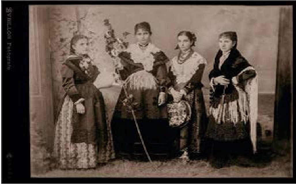
“Retrato de cuatro mozas”. Avrillon ca. 1860

En la sala de exposiciones de María Pita, se inauguró en septiembre una muestra con fondos del Archivo Municipal, sobre el trabajo de los Gabinetes Fotográficos de la ciudad en el siglo XIX. La Exposición se clausuró el 29 de noviembre y ha tenido mucho éxito y repercusión en La Coruña