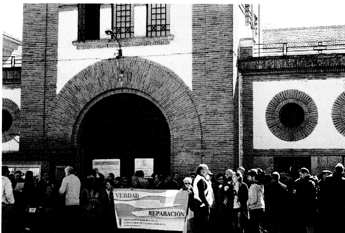
Puerta de la antigua prisión provincial de Cáceres, inicio de la IV Jornada-Homenaje. A todas las víctimas y a todos los represaliados por el franquismo en la ciudad de Cáceres, 12 de marzo de 2016.

Unos días más tarde y desde el ayuntamiento se hizo público una primera estimación realizada por técnicos municipales del posible coste de la rehabilitación del inmueble, que elevaron a 12 millones de euros 93 . Precisamente en el pleno municipal de ese mes de abril se acordó por unanimidad de todos los grupos municipales una moción en la que: