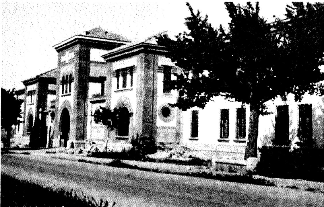
Puerta de la nueva prisión provincial de Cáceres, 1 de junio de 1936.