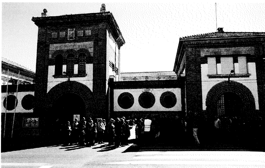
Puerta de la antigua prisión provincial de Cáceres, inicio de la III Jornada-Homenaje a todas las víctimas y a todos los represaliados por el franquismo en la ciudad de Cáceres, 14 de marzo de 2015.

Precisamente en la asamblea de socios celebrada casi un año después, el 14 de marzo de 2015, se acordó por unanimidad dos propuestas relacionadas con la antigua prisión provincial de Cáceres: ampliar su labor a la “atención a familiares que sufrieron prisión (represaliados) por su compromiso republicano o su lucha antifranquista” y solicitar la “creación de un espacio de memoria en la antigua cárcel provincial de Cáceres” 80 .