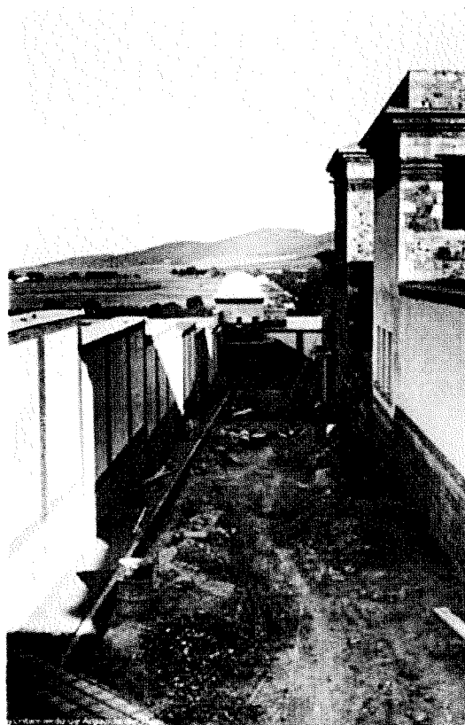
Obras en la nueva prisión provincial de Cáceres, 1 de junio de 1936 (3).