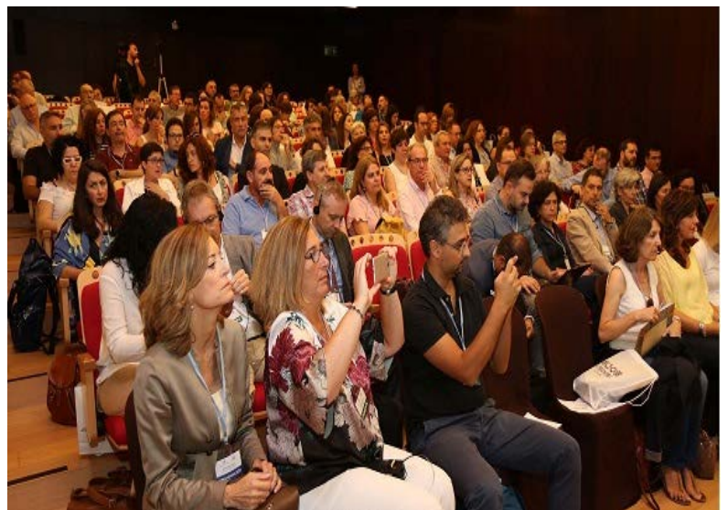
Un grupo de archiveros municipales durante el encuentro

Desde estas líneas queremos enviar nuestra más cordial felicitación a este grupo de profesionales que poco a poco ha ido avanzando, hasta llegar a un presente tan prometedor.