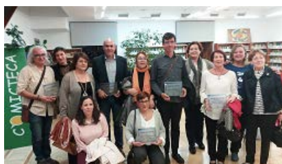
Imágenes de los premiados con nuestros compañeros de ANABAD Castilla-La Mancha