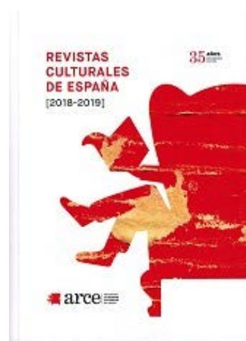
"Revistas Culturales de España 2018-2019" ARCE. Madrid. 2018