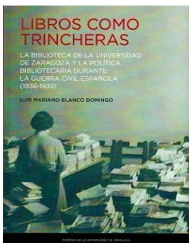
BLANCO DOMINGO, Luis Mariano. "Libros como trincheras" Servicio de Publicaciones, Universidad de Zaragoza. Zaragoza, 2018

https://www.facebook.com/FundacionBibliotecasSocial/