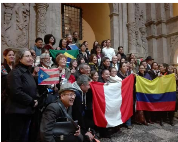
Participantes de varios países con sus banderas.