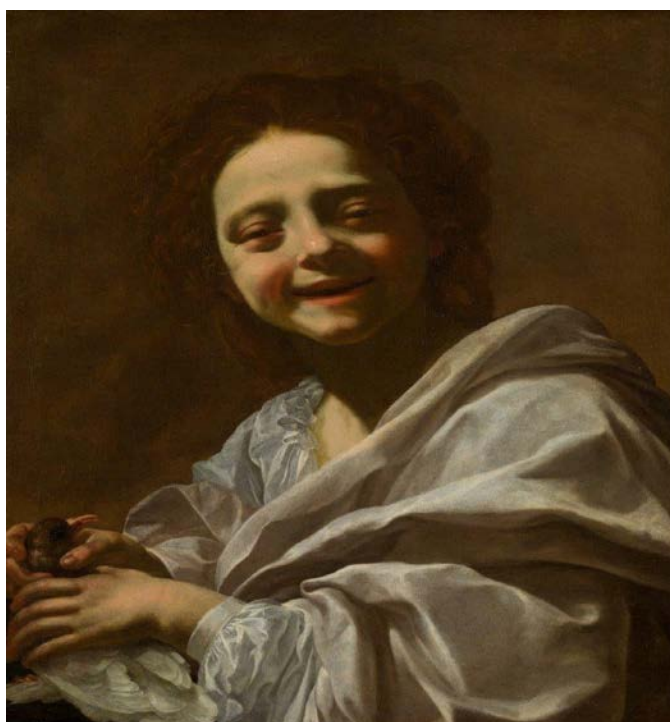
Retrato de niña con Paloma. Museo del Prado

El director del Museo del Prado, Miguel Falomir, ve esta iniciativa con mucho optimismo. España no tiene una Ley de Mecenazgo y confía en el cariño que la gente siente por el Prado para que esta original iniciativa sea un éxito. ¡Ojalá! Que haya muchos donantes que, por 5 euros, se conviertan en mecenas del Prado.