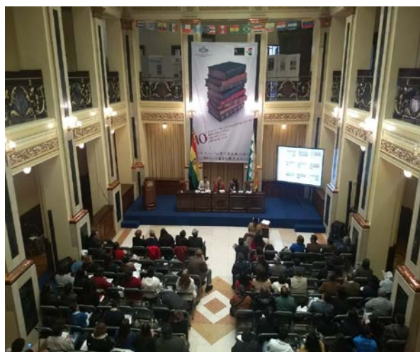
Aspecto de la clausura en el Museo Nacional del Arte.