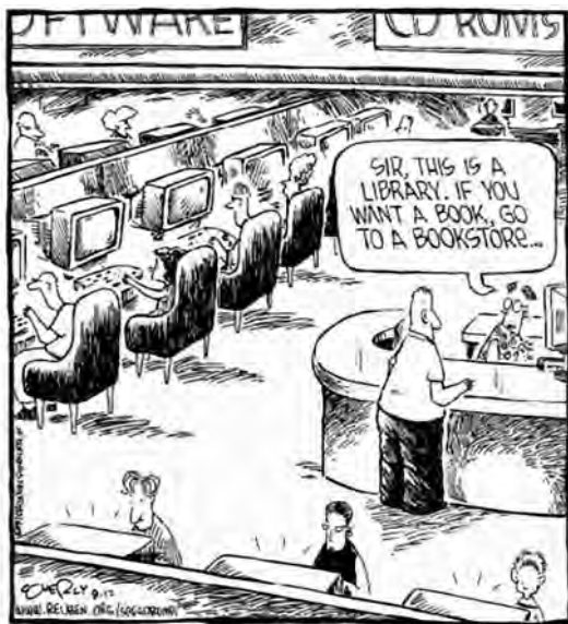
Imagen: Dave Coverly.

Tomada de http://personal.rhul.ac.uk/uhra/026/homepage.html