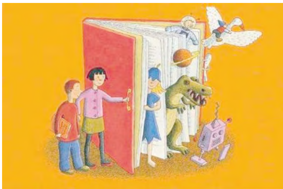
Ilustración de Leena Lumme. Sello conmemorativo del primer centenario de la Asociación finlandesa de bibliotecas.

De entre todas las metáforas relacionadas con la lectura y las bibliotecas, mi favorita es la de la "puerta". Por eso me he traído veinte de ellas a Jumilla, para compartirlas con vosotros, que me recibís con las vuestras abiertas de par en par.