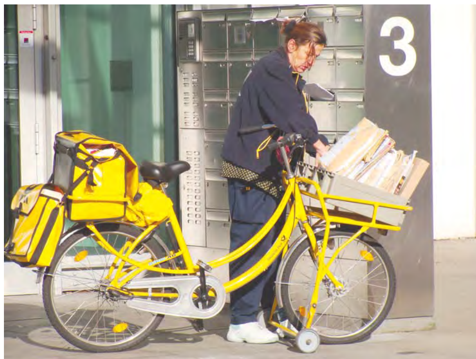
Imagen: Post cycle Cologne

... también un medio para comunicar individualidades: la del autor y el lector, las del ayer y el hoy, las de culturas remotas,