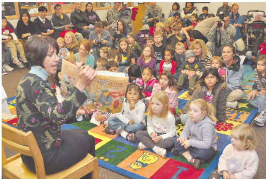
Imagen: Youngs at Library.

¿Y qué será lo nuestro en 2029? Lo mismo que ahora. Abrir puertas. Comunicar persona. Aportar VALOR HUMANO a la sociedad.