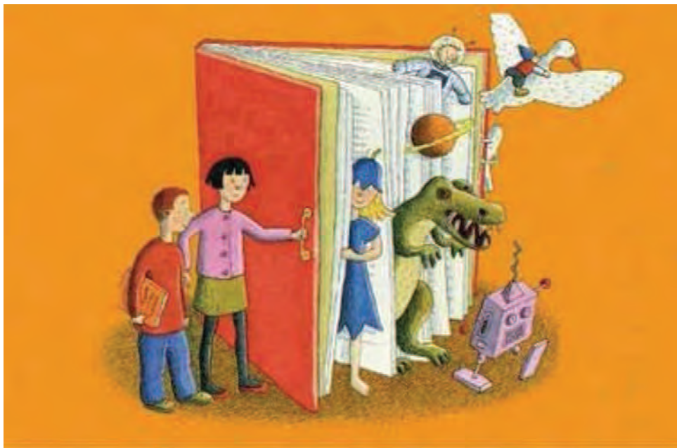
Illustration: Leena Lumme. Finnish stamp.

Amongst all the reading-related metaphors, my favourite is the "door". I brought twenty of them to Jumilla, in order to share them with you, as I find yours widely open for me.