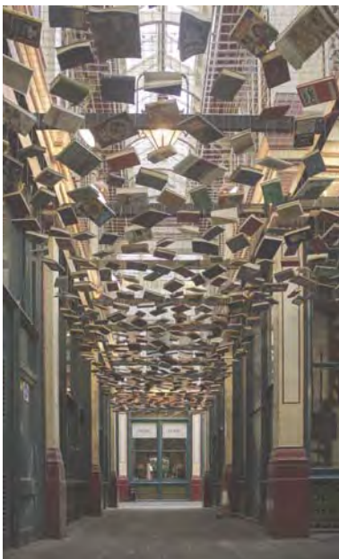
Imagen: Booksky. Autor: Atropos91 Licencia CC BY-NC. Fuente: Flickr.