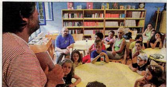
Niños, en una actividad de lectura en la biblioteca de Corvera.