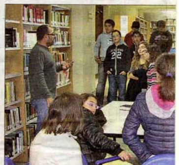
Un grupo de adolescentes, en la biblioteca de Tineo.

Visto como ponen las cosas, las bibliotecas públicas pueden tomar sus medidas.